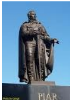
GENERAL MANUEL PIAR