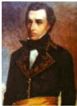
GENERAL MANUEL PIAR