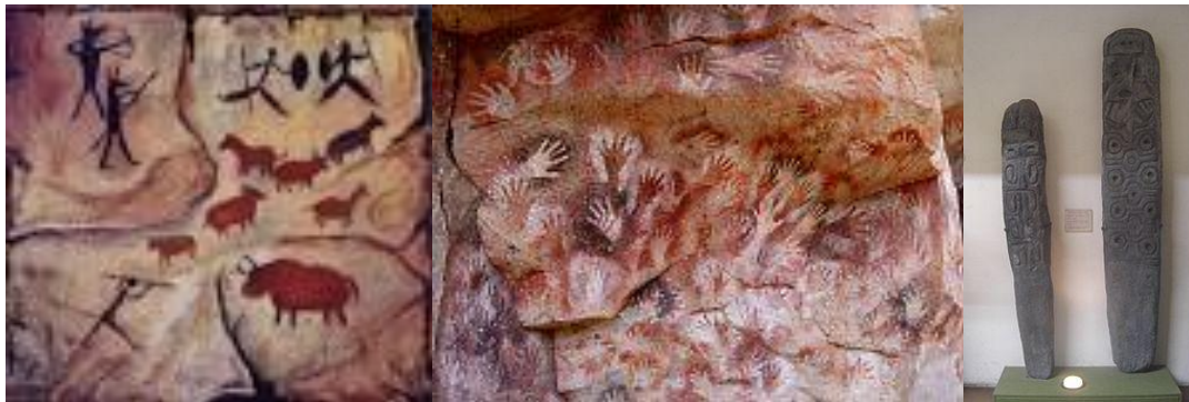
MUESTRAS INDIGENAS ENCONTRADAS EN ARGENTINA, DATAN DE 10 MIL A 20 MIL AÑOS.

un tipo de caballo americano ya extinguido hace mucho tiempo. Estos vestigios demuestran que el ser humano vivió en estas tierras de América hace diez o veinte mil años, con todas estas investigaciones hechas por científicos muy expertos en la materia, la conclusión de estos vestigios hace suponer que los primeros migrantes que llegaron a estos continentes americanos a través por un paso de tierra entre los dos continentes América y Asia, puesto que los últimos emigrantes Esquimales Asiáticos se sabe que llegaron hace cuatro mil años por el estrecho de Bering por las islas Aleutianas. Con esta pequeña introducción se entiende que toda la población indígena y blanca existente en el continente americano, llegó a estas tierras en tres diferentes migraciones. Siendo la de Colón la última migración.