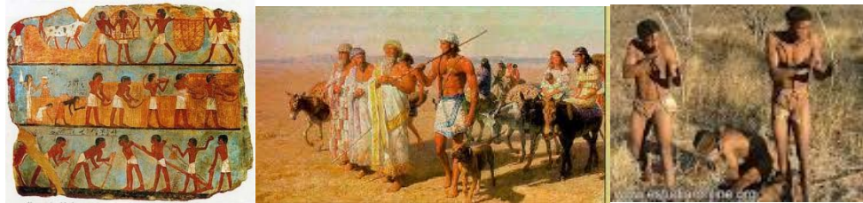
EGIPCIOS EUROAFRICANOS MEDITERRANEOS

Como quiera que en los tiempos de la prehistoria las migraciones marítimas masivas por el mar Atlántico resulten tan hipotéticas que casi puede asegurarse que todas las migraciones indígenas se realizaron del Continente Asiático. Quizá los indios prehistóricos tuvieron sus orígenes