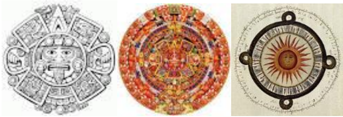
CALENDARIOS AZTECAS Y MAYAS.

Como quiera que en los tiempos de la prehistoria las migraciones marítimas masivas por el mar Atlántico resulten tan hipotéticas que casi puede asegurarse que todas las migraciones indígenas se realizaron del Continente Asiático. Quizá los indios prehistóricos tuvieron sus orígenes