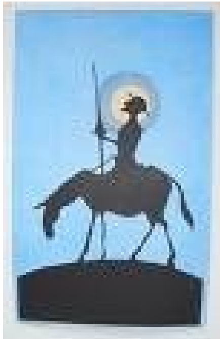
Don QUIJOTE El Caraqueño LEDESMA

El 29 de mayo de 1595, llegaron a la mente del alcalde Ledesma los recuerdos de lo sucedido en Margarita, en el mes de julio de 1561. Con el PRICEPE DE LIBERTAD DE LOS REINOS DE TIERRA FIRME, LOPEZ DE AGUIRRE ( EL TIRANO ) El veterano ALONSO ANDREA DE LEDESMA, Primer alcalde y corregidor de caracas murió al