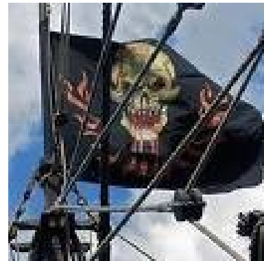
EL TIRANO LOPE DE AGUIRRE DIO EL PRIMER