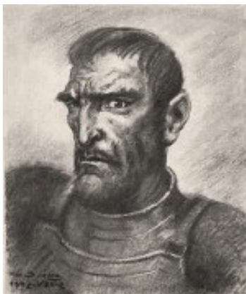
GRITO DE LIBERTAD

EL TIRANO LOPE DE AGUIRRE nació en el año 1510 en el Valle de Aráoz del Señorío de Oñate, entonces perteneciente al Reino de Castilla. Aráoz pertenece actualmente al municipio de Oñate, en la Provincia de Guipúzcoa (País Vasco). Aguirre se rebeló contra el rey Felipe II de España, al que envió cartas con un lenguaje correcto pero rebelde. Como consecuencia, él y sus hombres fueron perseguidos a lo largo de miles de kilómetros. Aguirre murió en 1561 en Barquisimeto, Venezuela. El día 27 de Octubre