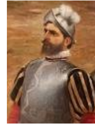
Embarcación de Aguirre