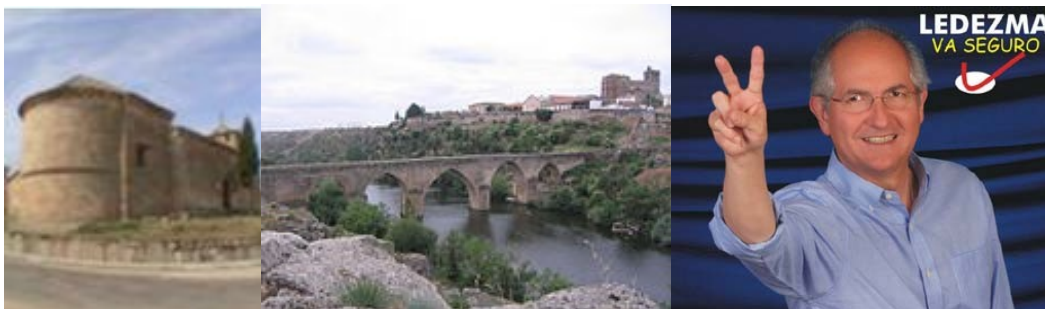
St. Elena y puente en Ledesma España y el actual Alcalde de Caracas Ledezma.

LINAJES DE LEDEZMA EN ESPAÑA Son linajes en España, como los Rodríguez de Ledesma, Nieto, Maldonado, Paz, Díaz de Ledesma, Figueroa, Chaves, Ulloa,