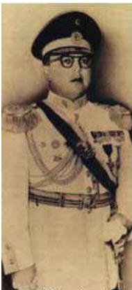
Pérez Jiménez fue el actor principal de la dictadura de la década de los 50

El General Marcos Pérez Jiménez. Fue el presidente más demócrata, más patriota y más progresista que tuvo Venezuela desde los días de la Independencia. El síndrome del General Pérez Jiménez, sólo era la construcción de Venezuela. Como el decía: “Yo haré que Venezuela sea la primera nación de toda Latinoamérica. La más grande, la más próspera y la más culta...Yo haré que se cumplan los pensamientos del Libertador Simón Bolívar. “Cesarán los partidos y se consolidará la unión, la Moral y Luces, son nuestras primeras necesidades”.