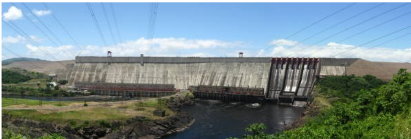
REPRESA DEL GURI