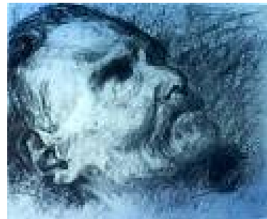
LOS MUERTOS DE LA LAGUNA NEGRA

Una pequeña linterna iluminaba esta fúnebre operación y, un murmullo se dejaba escuchar: ...Toma una bolsa de diamantes y otra de oro, el resto lo dejamos así hasta que pase todo. Ya nos llegará el tiempo de venderlo.