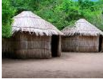
OBSTÁCULOS INDÍGENAS NATURALES DEL DORADO

Deseos les dijeron: ¡...Allá, mucho más allá de los tepuyes, existe un río donde las piedras todas son amarillas y las tribus que lo habitan tienen todos sus utensilios hechos de ese metal...!