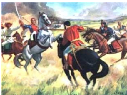
BATALLA DE ÚRICA

Ahora allí en la puerta de Caracas se repetía aquel antihumano espectáculo de la Guaira como símbolo de la “conciencia humana” proclamada por Simón por el libertador Simón Bolívar antes del decreto de guerra a muerte en su campaña admirable. “La cabeza frita en aceite del líder de la juventud venezolana, estaba allí esparciendo un olor nauseabundo a carne humana podrida, salía por los aires a los cuatro vientos, como anunciando la presencia de un desecho humano.