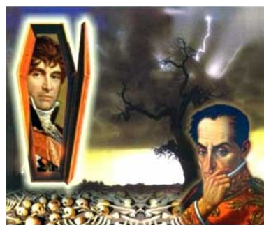
MUERTE DEL TAITA BOVES