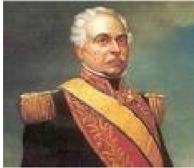
LA COSIATA DE PAEZ

Bolívar y de la unión de la Gran Colombia. Siendo los principales cabecillas José Antonio Páez, Juan José Flores y el colombiano Francisco de Paula Santander, que siempre había sido enemigo del libertador desde los tiempos de su campaña admirable.