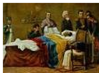
MUERTE DEL LIBERTADOR