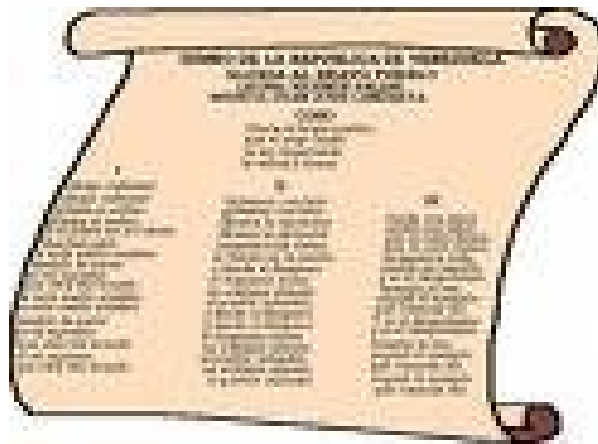
HIMNO NACIONAL DE VENEZUELA

l primer músico en ser tomado en cuenta por el caudillo Boves, fue Juan José Landaeta. José Tomas Boves, dejó sonar en la estancia una voz tenebrosa y estruendosa de caudillos. Pidió silencio total, para rendirle un muy merecido homenaje al autor de Gloria al Bravo Pueblo y, habérsele olvidado por completo las notas del himno nacional de España.