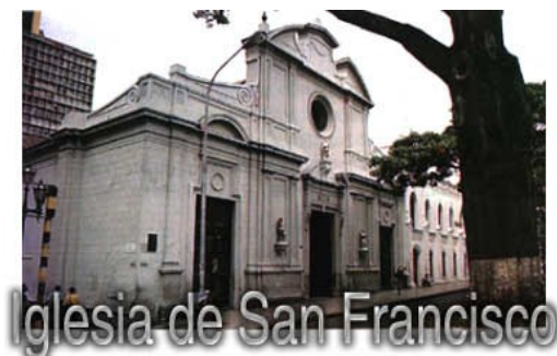
Iglesia de San Francisco

Simón Bolívar y José Félix Rivas, marchaban al frente de la emigración a