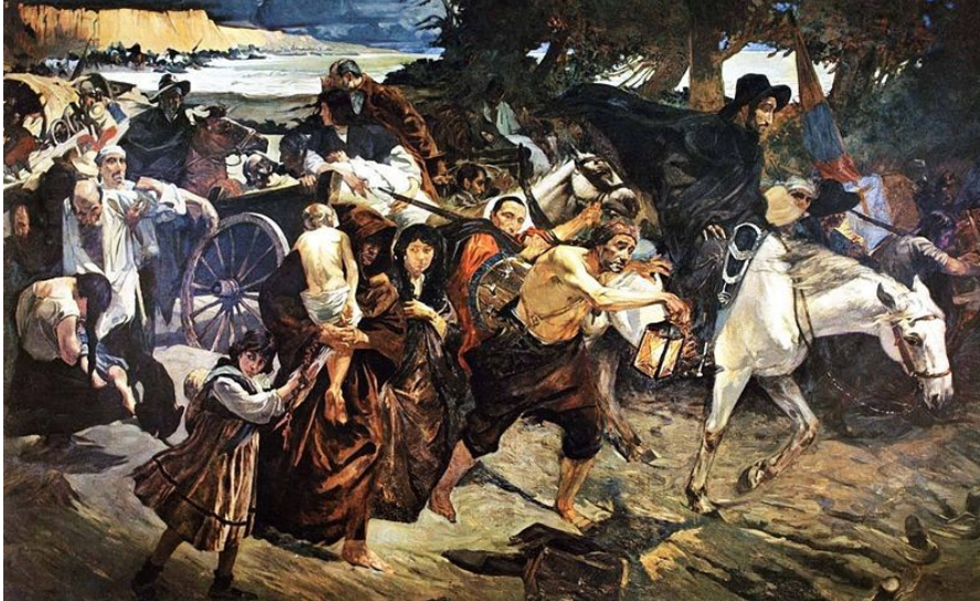
EMIGRACIÓN A ORIENTE

Oriente. De un total de treinta mil habitantes que tenía la ciudad de Caracas, 20.000 caraqueños, ancianos enfermos, mujeres y niños, abandonaban la ciudad en una noche de lluvia, para evitar ser degollados por los negros de Boves. Se decía que venían sedientos de ver correr la sangre de