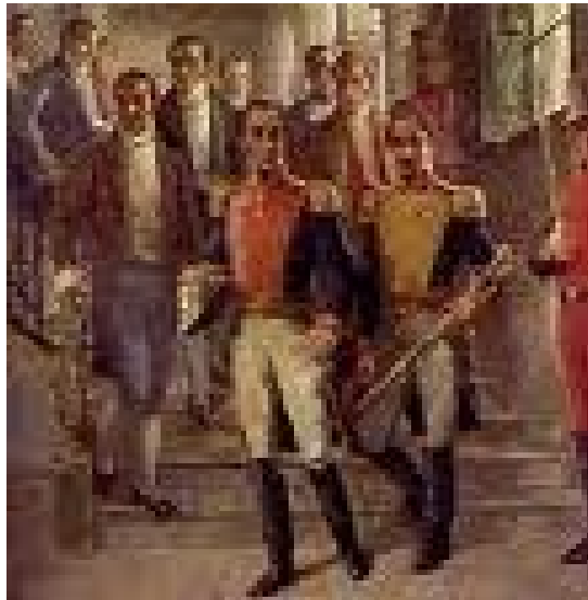
SIMÓN BOLÍVAR Y SANTANDER

LAS DIFERENTES CAMPAÑAS LIDERIZADAS POR SIMÓN BOLÍVAR TODAS PERTENECEN A LOS TIEMPOS MÁS NEGROS Y SANGRIENTOS DE VENEZUELA. POR LA FEROCIDAD Y ATROCIDAD DE SUS BATALLAS PARA QUÉ RECORDAR EN UNA DEMOCRACIA PACÍFICA ESTOS TIEMPOS BELICOSOS. LAS VERDADERAS CAMPAÑAS ADMIRABLES DEL LIBERTADOR SIMÓN BOLÍVAR, SÓLO FUERON EL “PASO DE LOS ANDES, LA BATALLA DE BOYACÁ Y LA BATALLA DE CARABOBO. ESTA ES UNA HISTORIA VERDADERA, CONTADA CON POCAS PALABRAS DE UNA MANCHA DE SANGRE QUE LIMPIA.