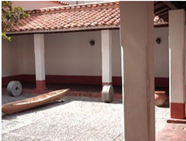
“CABALLERIZA DE SIMON BOLIVAR”

El hispanista Carlos Pereyra, estudioso de la genealogía del “Libertador”, en la cual cita sesenta apellidos de sus ascendientes, entre ellos los de Ponte y Andrade, curiosamente no remonta la ascendencia de este tatarabuelo de Simón, es posible que no tuviese la información que a continuación transcribo, o por otras causas que él pudo considerar conveniente no citar a los antepasados de este tatarabuelo gallego.