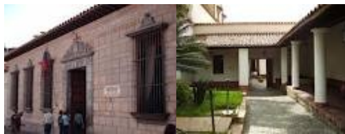
“CASA NATAL Y PATIO INTERIOR”

Participó en la fundación de la Gran Colombia, nación que intentó consolidar como una gran confederación política y militar en América, de la cual fue Presidente. Bolívar es considerado por sus acciones e ideas el "Hombre de América" y una destacada figura de la Historia Universal ya que dejó un legado político en diversos países latinoamericanos, algunos de los cuales le han convertido en objeto de veneración nacionalista. Ha recibido honores en varias partes del mundo a través de estatuas monumentos, parques, plazas, etc.