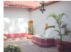
PATIO DE FUENTE

“CASA NATAL, EN DONDE NACIO SOMÓN BÓLIVAR”