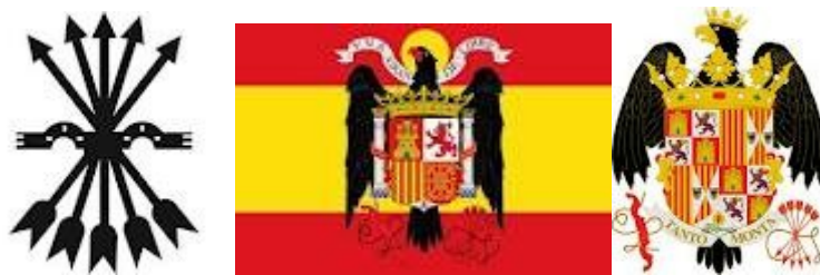
“SIMBOLOS DE FRANCISCO FRANCO”

Los años sesenta -con los «planes de desarrollo» y la influencia política del Opus Dei - fueron de rápido crecimiento económico, industrialización, apertura y urbanización: las mejoras materiales facilitaron el mantenimiento de Franco en el poder, a pesar del creciente anacronismo de su régimen; pero también produjeron cambios sociales que hicieron inviable su continuidad una vez muerto el general. Desde 1969 Francisco Franco había institucionalizado como sucesor al príncipe Juan Carlos, nieto del Alfonso XIII; tal previsión sucesoria se cumplió tras la muerte de Franco el 20 de noviembre de 1975, pero no fue acompañada de una continuidad política, ya que, sin romper con la legalidad vigente, el nuevo rey promovió una transición pacífica a la democracia.