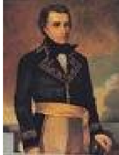
GENERAL MANUEL PIAR