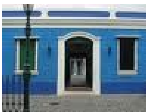
CASA PRISIÓN DE PIAR