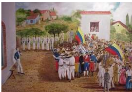
FUSILAMIENTO DEL GENERAL MANUEL PIAR

Héroes de Venezuela Julio Barreiro Rivas Escritor.