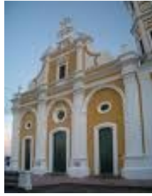
Catedral de Ciudad Bolívar

Al día siguiente de la ejecución de Piar, el Jefe Supremo procede a leer la siguiente proclama: “Soldados! Ya el General Manuel Carlos Piar, el Libertador del Oriente de Venezuela estaba muerto, ya no existía el peligro de que siendo hijo de un Príncipe Portugués, actualmente reinando en Brasil, se transformara de la noche a la mañana en el verdadero Libertador de este Continente ayudado por Brasil; y siendo así quedarían desplazados del proyecto Libertador. El Jefe Supremo Simón Bolívar y todos sus seguidores, ya no existe este peligro, puesto que “Muerto el perro, se acaba la rabia”. Ahora sólo nos queda enfrentarnos a los comentarios sobre el fusilamiento y el proceso a Manuel Piar.