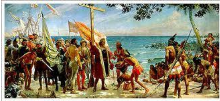
DESCUBRIMIENTO DE AMÉRICA, 12 DE OCTUBRE DE 1492

SEGUNDA PARTE DE LA FUENTE DE LA SABIDURÍA.